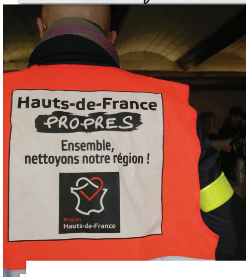
Opération « Hauts-de-France propres »