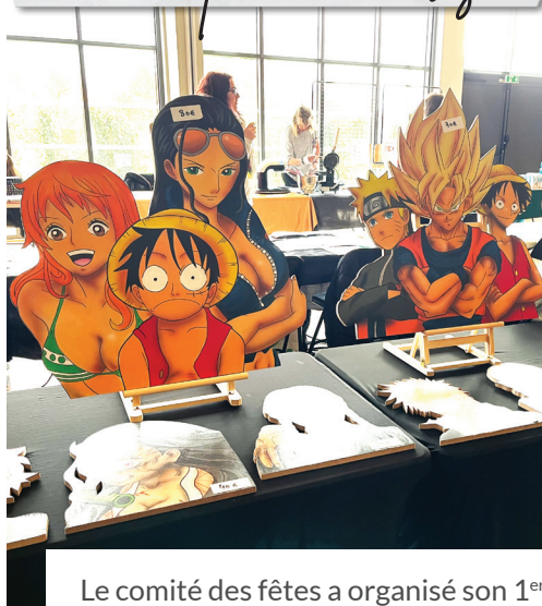
Le comité des fêtes a organisé son 1 er Salon Manga. Durant le week-end, les visiteurs ont pu découvrir et apprécier les créations des 20 exposants. De multiples animations ont enrichi et coloré l'événement !