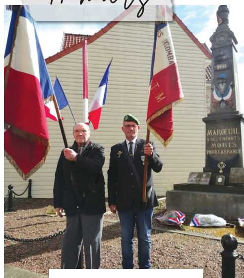
Cérémonie du 19 mars.