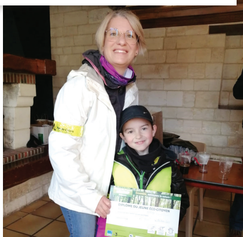
Un diplôme d'Éco-citoyen a été remis aux plus jeunes pour saluer leurs efforts.