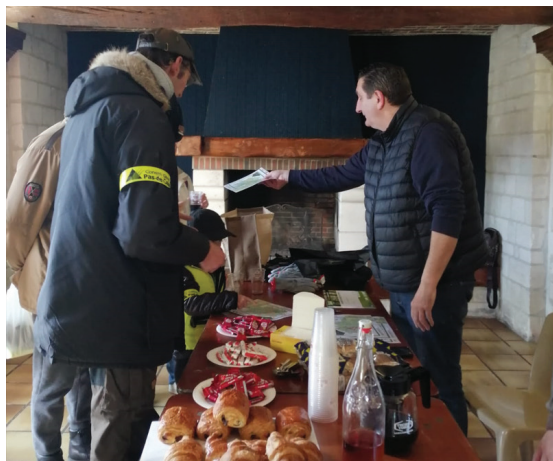
Les participants ont été chaleureusement accueillis à la Ferme communale avec "eune goutte eud'jus" et des croissants.