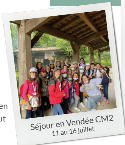
Séjour en Vendée CM2 11 au 16 juillet

La municipalité a organisé en partenariat avec Tootazimut des séjours pour les jeunes en juillet.