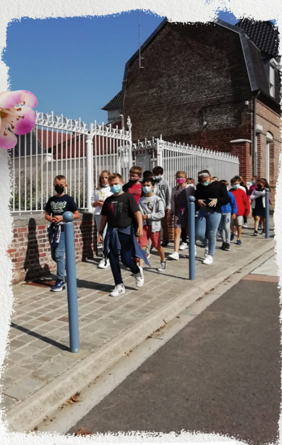
C'est la rentrée !