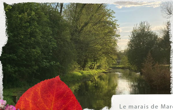
Le marais de Maroeuil