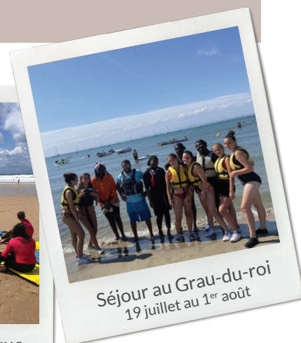
Séjour au Grau-du-roi 19 juillet au 1 er août