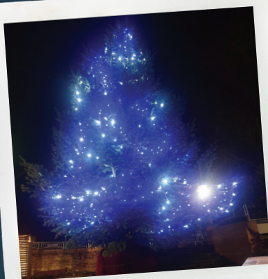
Le sapin de 7 mètres de haut illuminé