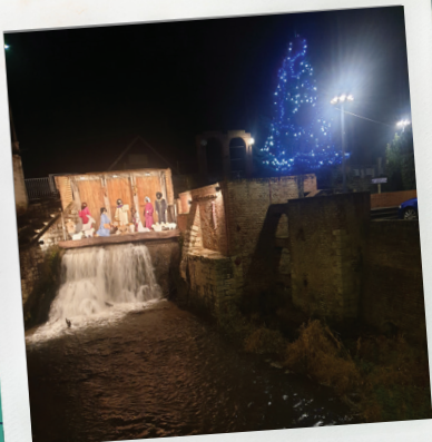
La crèche et le sapin près de la cascade