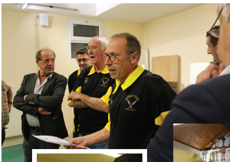
Le club de javelot