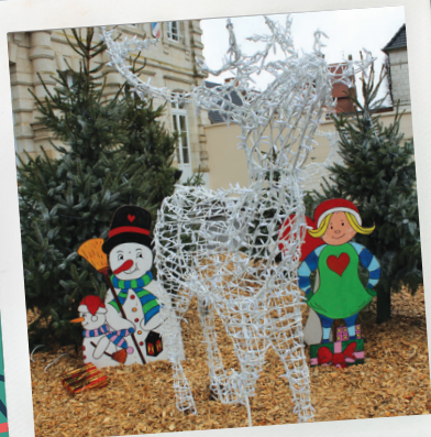
Illuminations Mairie de Maroeuil