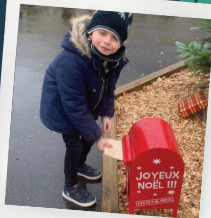
La boîte aux lettres du Père Noël est à Maroeuil !