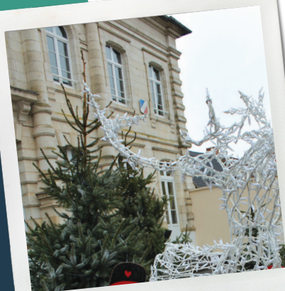
Illuminations Mairie de Maroeuil

L'ensemble de l'équipe municipale vous souhaite d'excellentes fêtes de fin d'année, entourés des vôtres, et vous adresse ses meilleurs vœux pour l'année nouvelle !