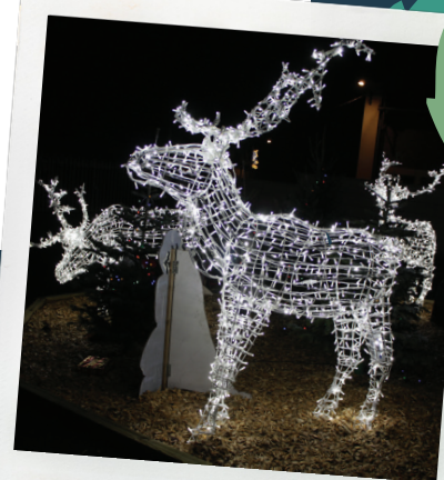
Illuminations Mairie de Maroeuil