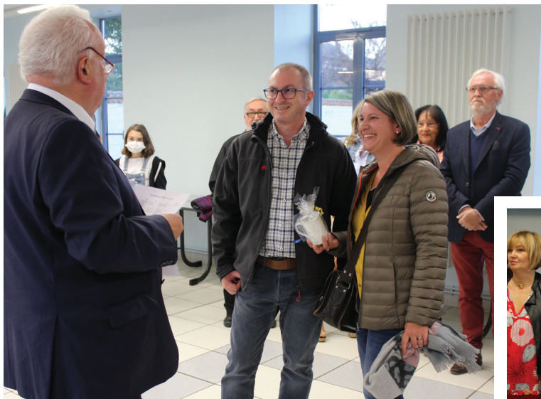
Accueil des nouveaux arrivants à Maroeuil