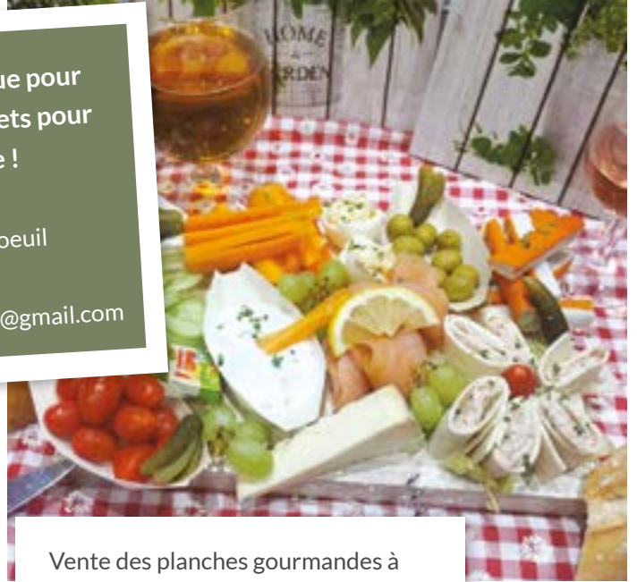
Vente des planches gourmandes à partager entre amis organisée lors de la fête champêtre du 14 mai à Etrun.