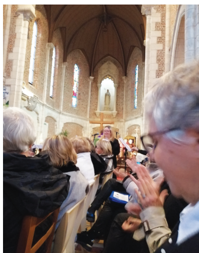
Concert de la Sainte Cécile en l'église de Maroeuil avec l'Harmonie de Maroeuil et la Chorale Mélismélodies.