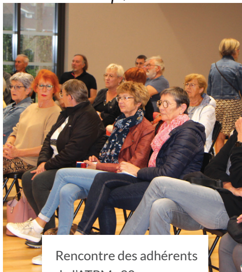
Rencontre des adhérents de l'ATPM. 90 personnes étaient présentes.