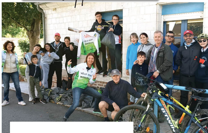
L'opération « Village propre » organisée par le Vélo Vert Marœuillois.

Voyage à Malaga du 29 septembre au 6 octobre pour 35 participants, membres de l'ATPM.