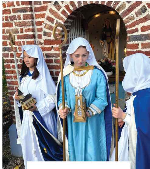
Procession Sainte Bertille.