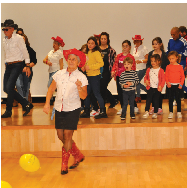
Présentation par le Country Club d'Athies auprès du public venu assister à la manifestation au profit du Téléthon.